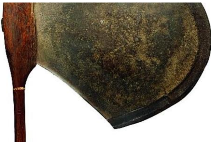
Chez Patrick et Ondine Mestdagh, cette hache d'apparat Songye – Sanga en fer et bois (RDC, XIXe siècle), avec une lame de 46 cm

Belle idée que celle de Pierre Loos – qui fut déjà le promoteur, il y a plus d'une vingtaine d'années, de la Bruneaf (Brussels Non European Art Fair) – d'organiser ce Winter B Sablon !